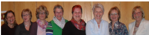
Dekanatsfrauenbeauftragten und Kontaktfrauen (Treffen April 2016)

Informationen der Frauenarbeit werden per Email aktuell übersandt – melden Sie sich, falls Sie in den Verteiler aufgenommen werden möchten oder die Infos mittlerweile nicht mehr erhalten: wittmann.ingrid@gmx.de